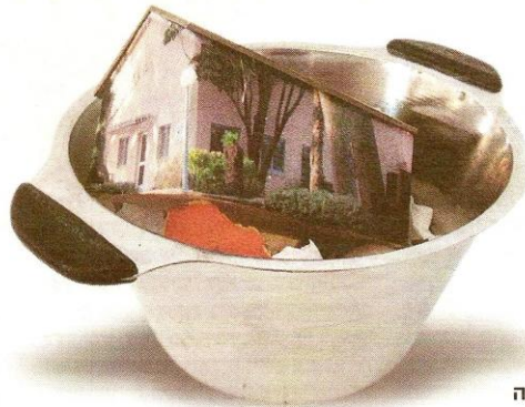
עבודה של נאוה הראל שושני