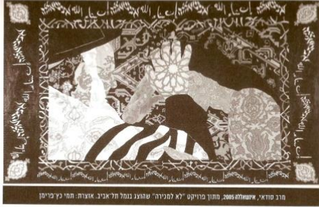
חנן סודא, אישולח 2005, מתוך מיוקס "לא למינה" שמונח במלחל איבי. אצוה: תמי כרימיין

אורינטליזם של אדוארד סעיד שפורסם ב-1978, מצוין על-ידים כנקודת המעבר בין "השלב הראשון" (פרספקטיבת העולם השלישי) לשני - "הביקורת הפוסטקולוניאלית". שנהב וחבר מציינים בהירות את הספר האימפריה כותבת חודה. תיאורה ומעשה בספרות פוסטקולוניאלית בעריכת אשקרופט טיפין וגריפית, שהתפרסם ב-1989 נקטט הראשון של הלימודים הפוסטקולוניאליים בתחום הספרות, אולם אין ספק כי מהלכי מחקר ספרותי מרובים ושונים אשר נעו בכיוון זה נוצרו עוד קודם לכן. ספרו החשוב של אדוארד סעיד העולם הטקסט והמבקר פורסם ב-1983, ובשנת 1986 התפרסם טקסט שאיך בערמוניות את מסד הידע השמרני, האירופוצנטרי - מתוך יריעה והגדרה, הקרוי "ספרות השוואתית" או "ספרות כללית"; פרדריק גיימסון פרסם את מאמרו "ספרות העולם השלישי בעידן הקפיטליזם הרב-לאומי". הטקסט יצר כלים תיאורטיים חדשים מלהיבים לבחינתה והמשנתה של "ספרות מיעוטים" או "ספרות פרופריאלית". באותה שנה, 1986, פרסם גם האפרו-אמריקני הנאי לואיס גויטס את הספר החלוצי נוע, כתיבה וחבל, ספר שמונח את הספרות האפרו-אמריקנית הנכתבת ב"אנגלית שחורה", אשר הורדה מן הקאנון. גם הטקסט קמקא: לקראת ספרות מיונית, שפורסם ב-1975 על-ידי ז'יל דלו ופליקס גאטארי הלך ותפס תאוצה במרחב המחקרי. כך נוצרו סדרותיו של מחלק בעל חץ כפול. אתגר נוקב של תחום הידע הקרוי "ספרות אנגלית" וביומנית - רעור סדרותיה של ה"ספרות השוואתית". פוטנציאל הריסוק שהיה טמון בן-עצמה האינטלקטואלית ובאגנדה הפוליטית שליוותה את